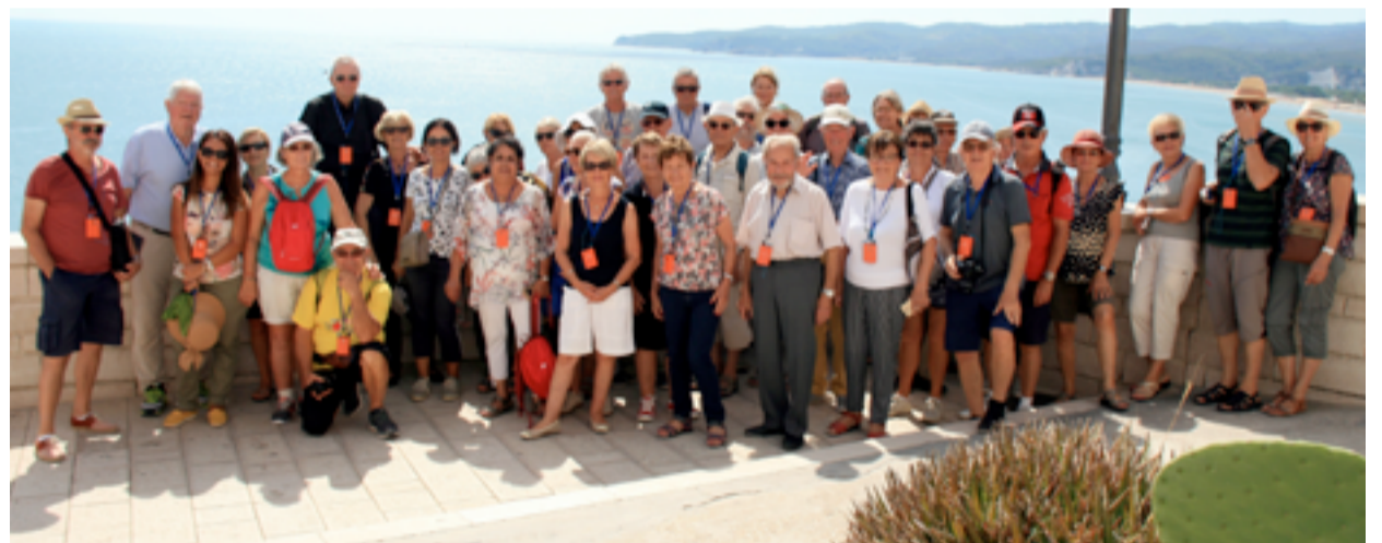
Les participants au voyage-Les Pouilles- septembre 2018

Cette AG se clôture par une projection-vidéo du voyage de septembre et le verre de l'amitié aux saveurs italiennes.