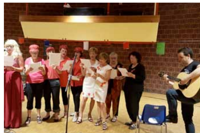
La belle fête annuelle des cours le 1er juin 2017