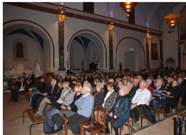
Un public nombreux